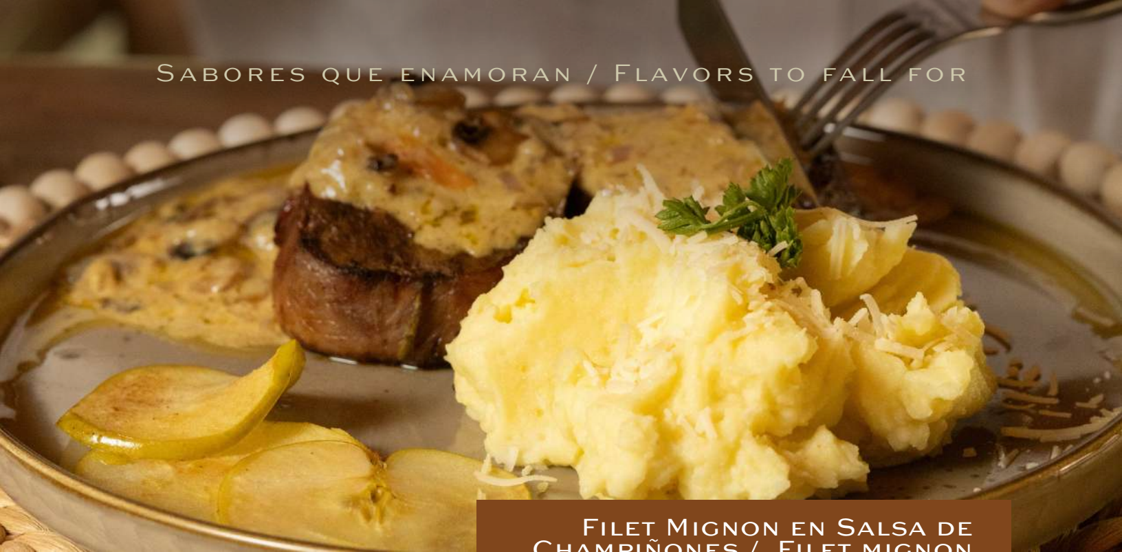
FILET MIGNON EN SALSA DE CHAMPIÑONES / FILET MIGNON IN MUSHROOM SAUCE

SABORES QUE ENAMORAN / FLAVORS TO FALL FOR